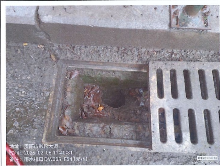
雨水排放口 4DW005FS4 (无水)