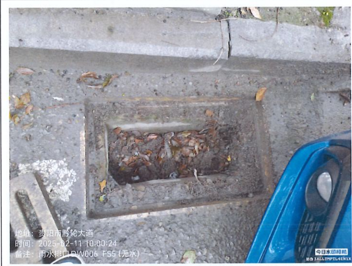
雨水排放口 5DW006FS5 (无水)