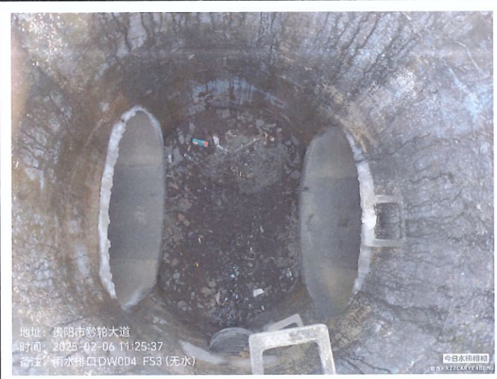
雨水排放口 3DW004FS3 (无水)