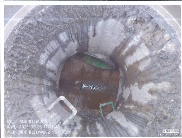
雨水排放口 1DW002FS1 (无水)