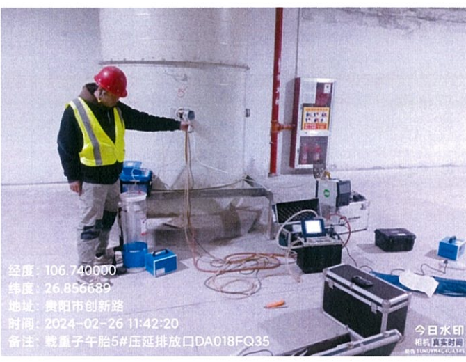
载重子午胎 5#压延排放口 DA018FQ35