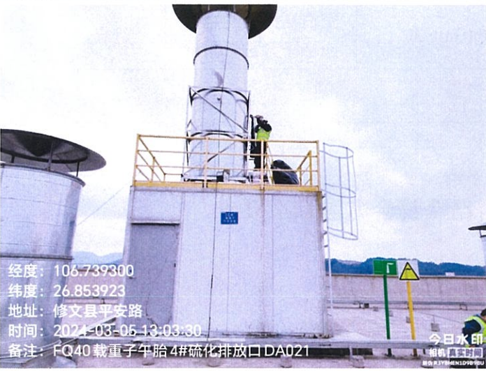
载重子午胎 4#硫化排放口 DA021FQ40