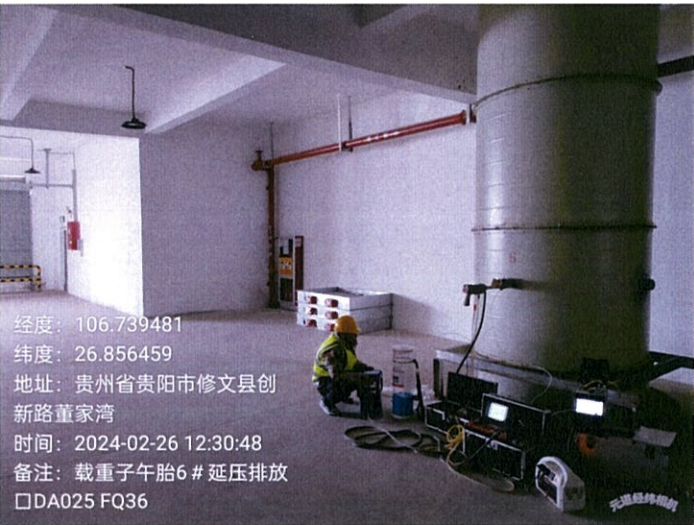
载重子午胎 6#压延排放口 DA025FQ36