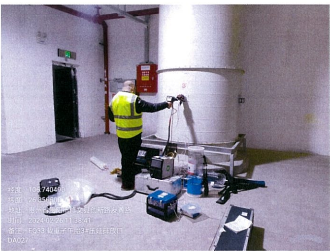
载重子午胎 3#压延排放口 DA027FQ33