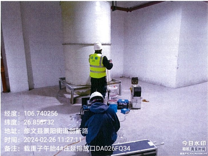
载重子午胎 4#压延排放口 DA026FQ34