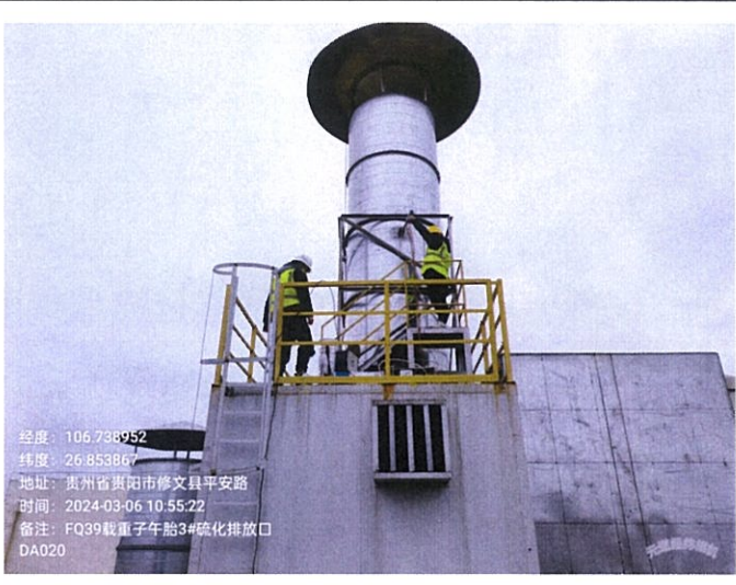
载重子午胎 3#硫化排放口 DA020FQ39