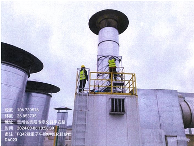
载重子午胎 6#硫化排放口 DA023FQ42