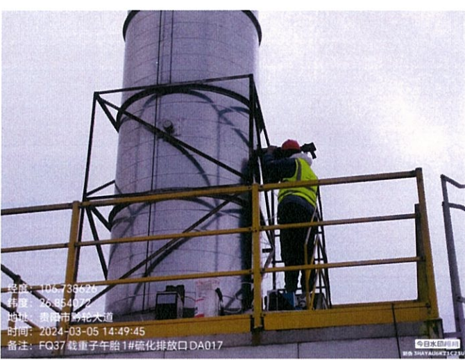
载重子午胎 1#硫化排放口 DA017FQ37