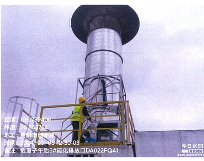
载重子午胎 5#硫化排放口 DA022FQ41