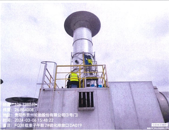
载重子午胎 2#硫化排放口 DA019FQ38