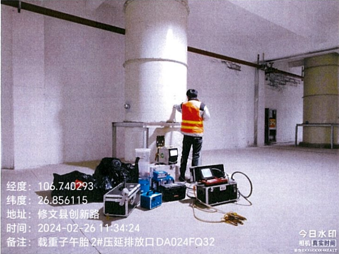
载重子午胎 2#压延排放口 DA024FQ32