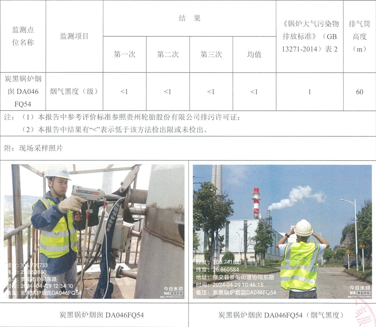
表 5-2 有组织废气（FQ54）监测结果

2024 年 4 月 29 日对贵州轮胎股份有限公司 2024 年第二季度自行监测项目进行现 场采样。监测过程中对样品采取全程空白样分析、实验室平行样分析、实验室空白样 分析、质控样分析等质控措施。现场质控结果如表 6-1，平行双样分析精密度控制合格 率情况如表 6-2，质控样或加标回收控制合格率情况如表 6-3。