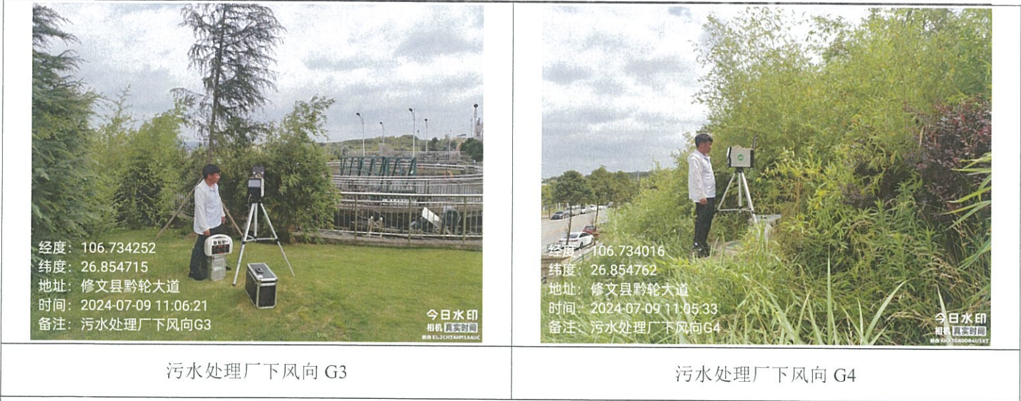
附：无组织监测点位示意图