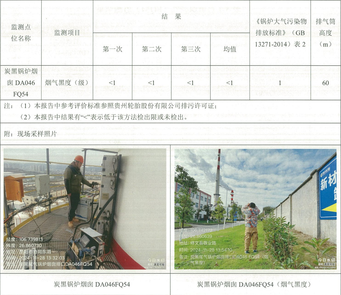
表 5-2 有组织废气（FQ54）监测结果

2024 年 11 月 28 日对贵州轮胎股份有限公司 2024 年第四季度自行监测项目进行现场采样。监测过程中对样品采取全程空白样分析、实验室平行样分析、实验室空白样分析、质控样分析等质控措施。现场质控结果如表 6-1，平行双样分析精密度控制合格率情况如表 6-2，质控样或加标回收控制合格率情况如表 6-3。