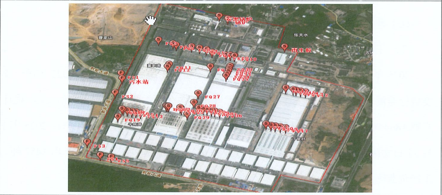
附：监测点位示意图

2025 年 1 月 13 日、1 月 17 日、2 月 6 日对贵州轮胎股份有限公司 2025 年第一季度自行监测项目进行现场采样。监测过程中对样品采取全程空白样分析、实验室空白样分析等质控措施。现场质控结果如表 6-1。