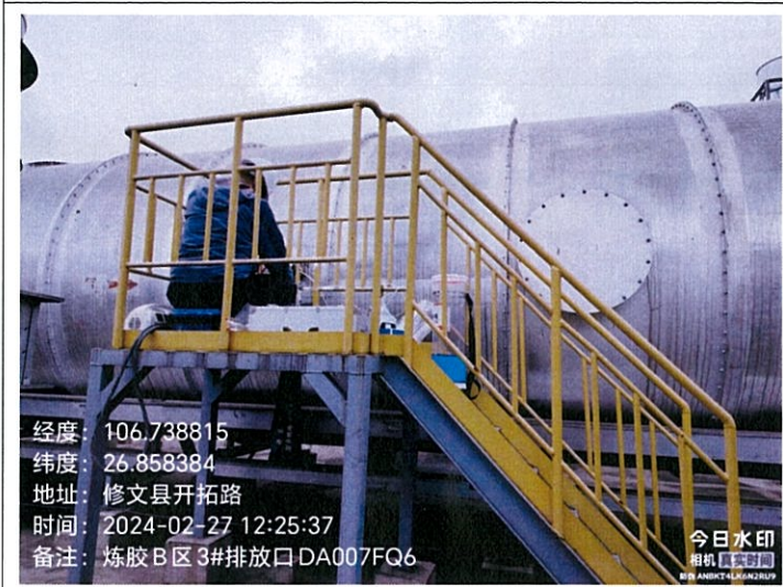
炼胶 B 区 3#排放口 DA007FQ6