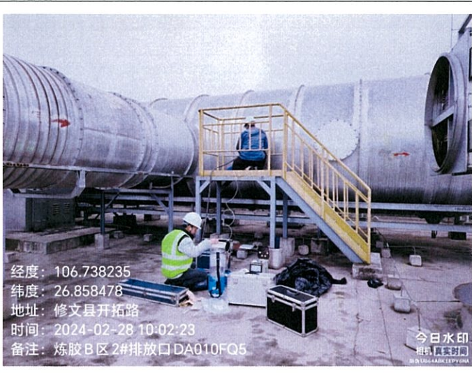
炼胶 B 区 2#排放口 DA010FQ5