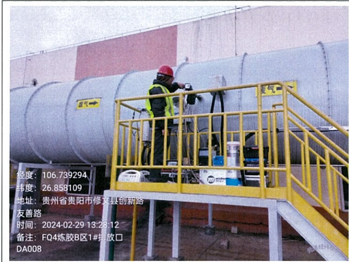
炼胶 B 区 1#排放口 DA008FQ4