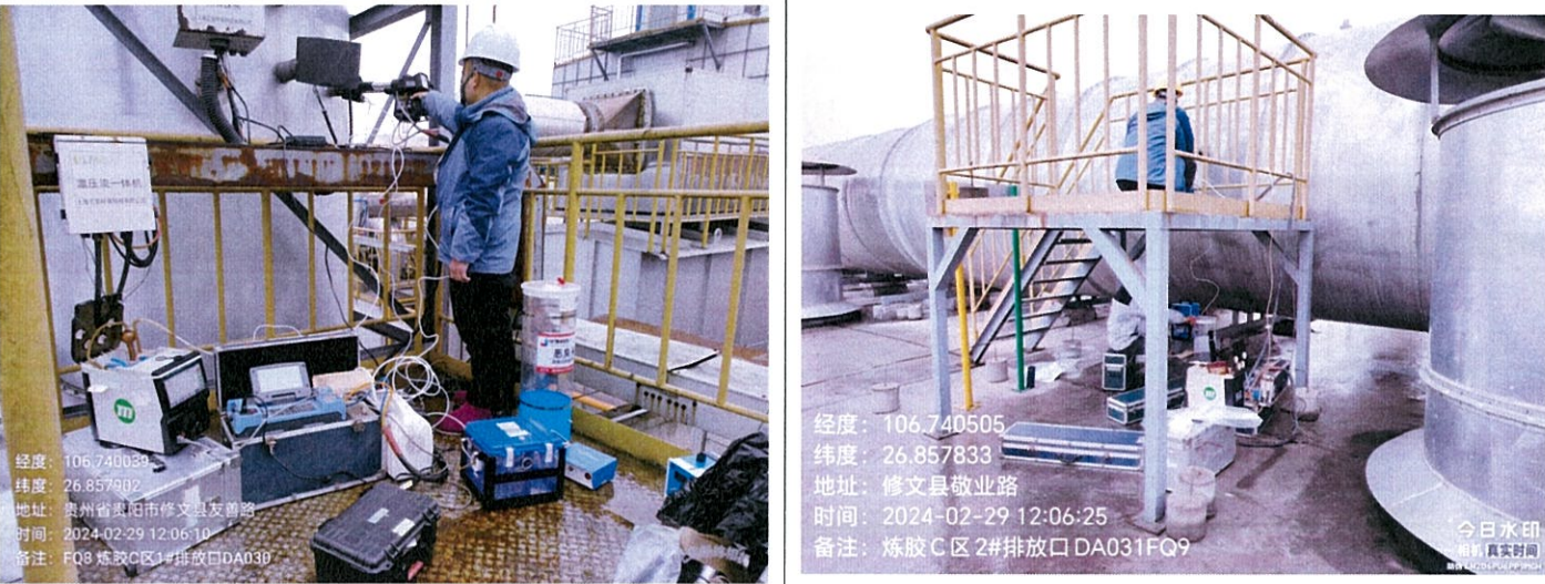
炼胶 C 区 1#排放口 DA030FQ8 炼胶 C 区 2#排放口 DA031FQ9