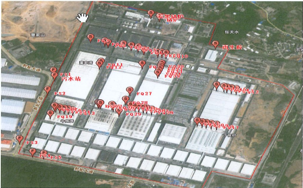
附：监测点位示意图

2025 年 2 月 10 日、2 月 11 日、2 月 12 日对贵州轮胎股份有限公司 2025 年第一季度自行监测项目进行现场采样，2025 年 2 月 11 日至 2 月 13 日进行监测分析。监测过程中对样品采取全程空白样分析、实验室空白样分析等质控措施。现场质控结果如表 6-1。