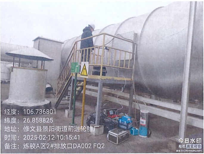
炼胶 A 区 2#排放口 DA002FQ2