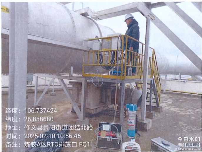
炼胶 A 区 1#排放口 DA001FQ1