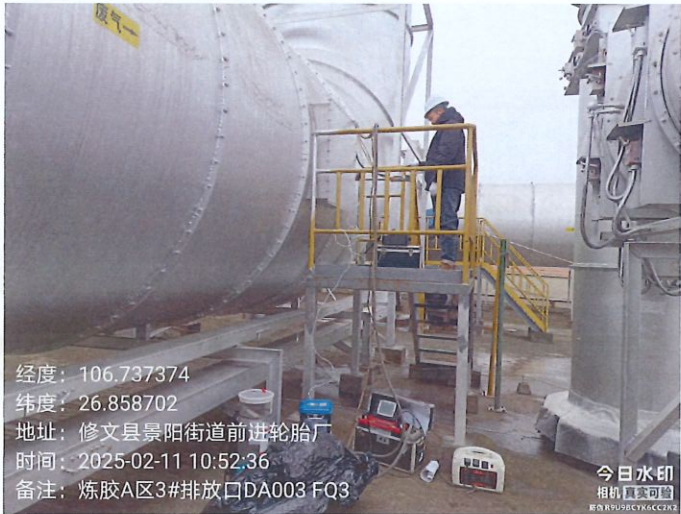
炼胶 A 区 3#排放口 DA003FQ3