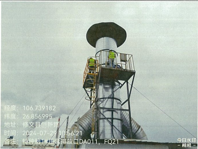
特种胎 1#压延排放口 DA011FQ21