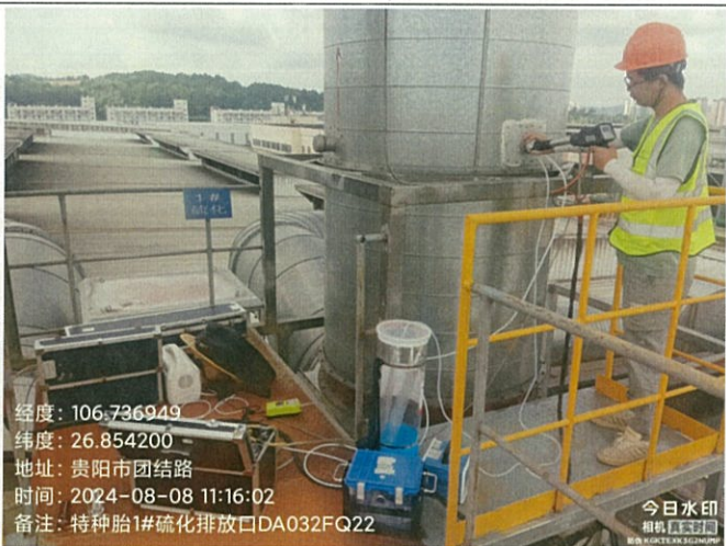
特种胎 1#硫化排放口 DA032FQ22